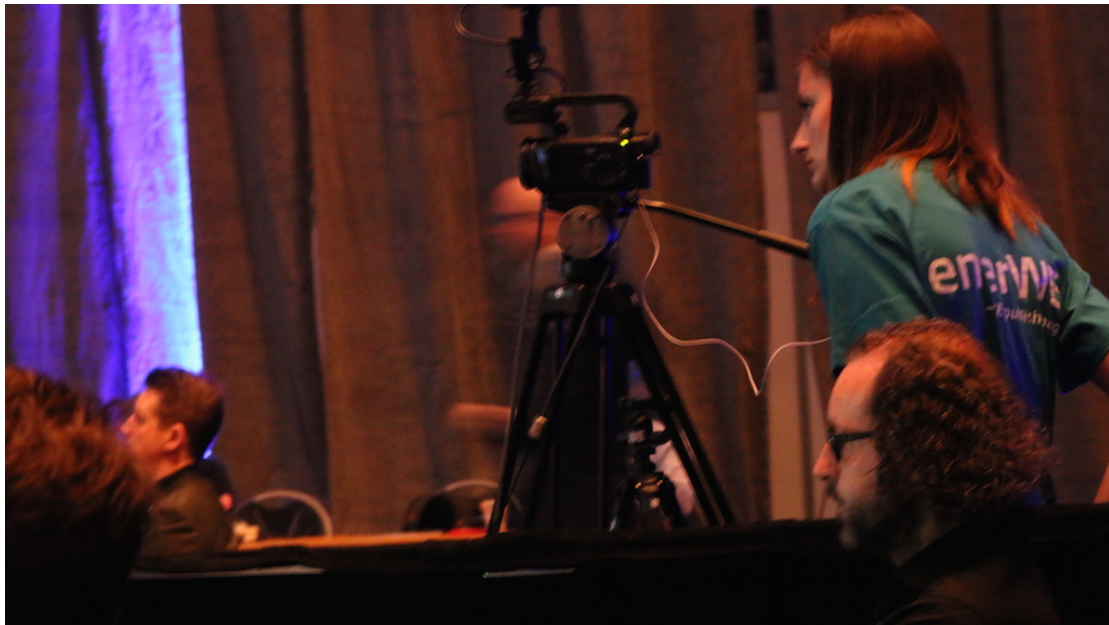
Bilde 1 enerWE er mediepartner med toneangivende arrangementer